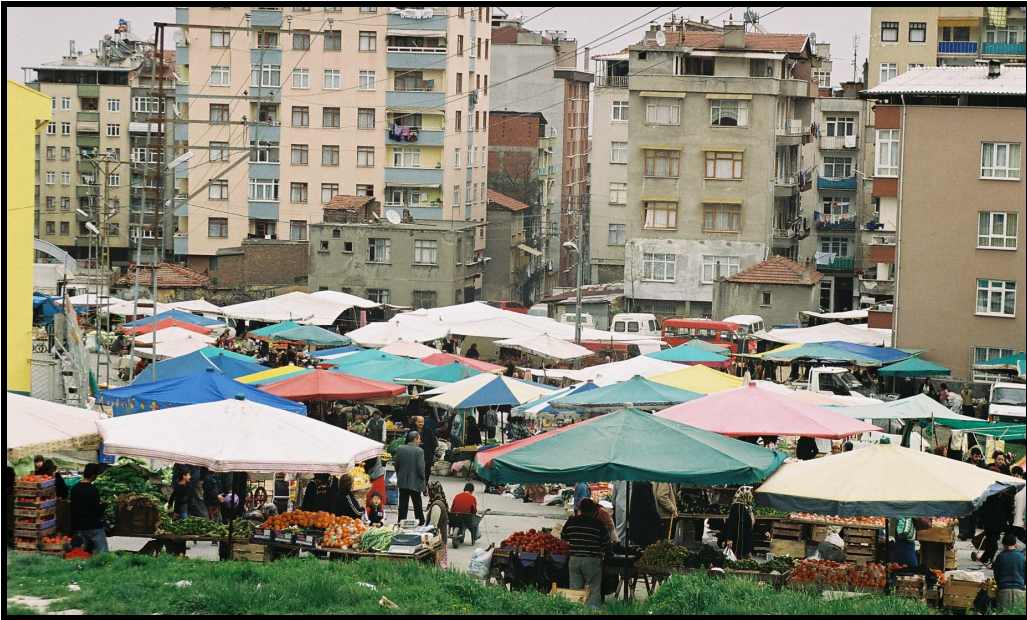
Foto 4: Eski yerini Toplu Konutlara kaptıran Selahiye semt pazarı yeni yerinde.