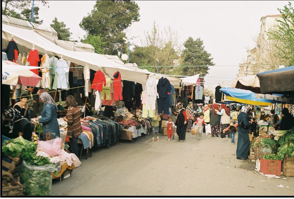
Foto 8: Hastanebaşı Pazarı 'nda hazır giyim ürünleri satan pazarcı.

yoğunluğu nedeniyle hazır giyim eşyası satan pazarcılar diğer pazarcılarla karışık vaziyette yer almakta, nadiren 2-3 tanesi yan yana gelmektedir.