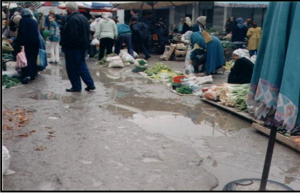
Foto 10: Selahiye semt pazarında yağışlı bir havada yerde biriken sular arasında satılan sebzeler.

tehlikesini beraberinde getirdiği gibi, bir kısım duyarlı vatandaşlarımızın pazarlardan uzak durmasına neden olarak köylünün getirdiği ürüne olan talebi azaltmakta, pazarların gerekli fonksiyonu yerine getirmesine engel olmaktadır. Görevli kişi ve kurumların bu konudaki duyarsızlıkları ise ibret vericidir. Sırf bu nedenle pazar kurulan cadde ve sokakların diğerlerinden daha temiz ve düzenli olması gerekmekte, çok kısa aralıklarla rögarlar yapılarak suların birikmesi ya da yüzeysel akışa geçerek sergilere bulaşması engellenmelidir.