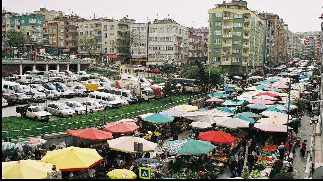
Foto 1: Park ve otoparka çevrilen eski Modern Pazar (solda) ve buraya alternatif pazaryeri seçilen Ağabali Caddesi (sağda).