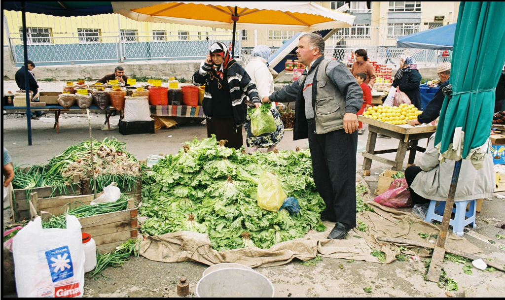
Foto 6: Selahiye Pazarı'nda yere sergi açarak satış yapan köylü pazarcı (önde) ve tezgâh üzerinde kuru gıda ve baharat satan şehirli pazarcı (arkada).

- Pazaryerlerinde tezgâh sahipliğine bakarak köylü ile şehirli pazarcıyı birbirinden ayırmak mümkündür. Şehirde oturup geçimini pazarcılıktan sağlayan esnafın pazaryerlerinde ahşap tezgâhları vardır. Şehrin uzak ve yakın çevresinden gelen köylüler ise pazaryerinde tezgâhları olmadığı için, getirdikleri ürünleri yere açtıkları sergiler üzerinde satmaktadırlar ( Foto 6 ).