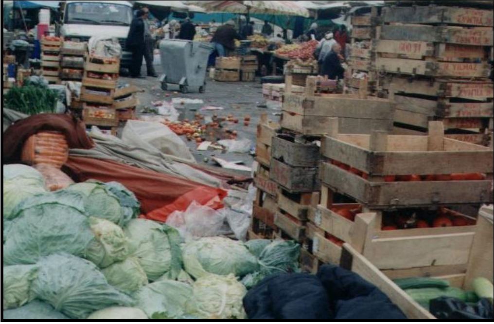
Foto 11: Selahiye semt pazarında öğleden sonra bir görünüm. Satılan ürünlerin boş kasaları, rasgele atılmış çürük sebzeler ve satılmayı bekleyen diğer ürünler, uçuşan sinekler, yayılan pis kokular ve boş çöp kutusu bir arada.

- Semt pazarlarında gerçek manâda yeterli kontrol ve denetim yoktur. Belediye zabıtası etkin olarak görev yapamamaktadır. Bunun sonucu olarak da; özellikle süt ve süt ürünleri denetimsiz kalmakta, bunları satanların bulaşıcı bir hastalığı olup olmadığı bilinmemekte, gıda ürünleri ilgili tüzüklere aykırı olarak satılmakta, uyduruk markalar, ne eti olduğu belli olmayan salam ve sucuklar veya hormonsuz, organik gibi tamamen satıcının kendi uydurduğu ve yazdığı etiketlere sahip çoğu hileli ürünlerle vatandaş aldatılmaktadır. Bunların ne derece gerçeği yansıttığını söyleyecek bir merci bulunmadığı gibi, ilgili yönetmeliklere göre üretilip üretilmediklerini denetleyen de yoktur. Daha da kötüsü temizlik ve deterjan gibi kimyasallarla gıda ürünleri çoğu zaman yan yana satılmakta, bir kısım pazarcılarının ise kullanılmış eski poşetleri yeniden kullanmasıyla gıda güvenliği hiçe sayılmaktadır.