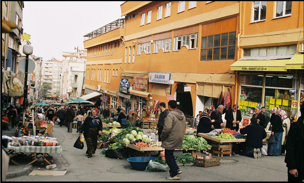
Foto 2: İlkadım Belediyesi Kültür Merkezi'ne dönüştürülen eski çok katlı pazaryeri (sağda) ve Unkapanı Caddesi üzerine kurulan yeni Hastanebaşı Pazarı.