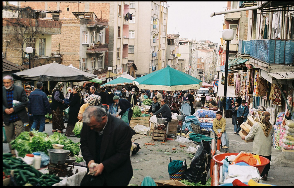
Foto 5: Unkapanı Caddesi üzerinde Hastanebaşı Pazarı'ndan bir görünüm. Cadde üzerindeki dükkân sahipleri kendi mallarını sergilemek ve satmak için dışarıdan gelen pazarcıları cadde ortasına ötelemiş.

- Pazarlar kuruldukları yerdeki esnaf için de büyük önem taşımaktadır. Örneğin Hastanebaşı Pazarı'nın yer aldığı Unkapanı Caddesi üzerindeki esnaf pazar kurulduğu gün hem pazara gelen kalabalık müşteri kitlesine, hem de pazarcılara satış yapmaktadır ( Foto 5 ).