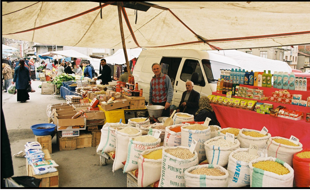
Foto 7: Selahiye semt pazarında kuru gıda, bakliyat gibi kantariye ürünleri ile temizlik malzemelerini bir arada satan şehirli esnaf-pazarıcı.

Köylüler kış mevsiminde marul, soğan, ıspanak vb., yaz mevsiminde ise domates, biber fasulye gibi sezonluk ürünlerini satmaktadır. Tezgâh sahibi şehirli esnaf ise ya halden aldıkları (mevsimine göre Samsun’da yetişmeyen, bu nedenle de köylünün pazara getiremediği) daha çok sera ürünü sebzeleri, ya da hem pazara gelen müşterilere, hem de köylerden gelip malını satarak kazandığı parayla ihtiyaçların gidermeye çalışan köylülere satmak üzere kuru gıda, zeytin-peynir, deterjan gibi ürünleri satmaktadırlar ( Foto 7 ). Benzer durum meyve için de geçerlidir. Yine yere açtıkları sergilerde satış yapan köylüler ellerindeki kendi bahçelerinin ürünü olan mevsimlik meyveleri satarken, tezgâh sahibi esnaf halden aldığı meyveleri satmaktadır. Kısaca özetlemek gerekirse Samsun semt pazarlarında köylü satıcı sayısı yere açılan sergi sayısı ile orantılıdır.