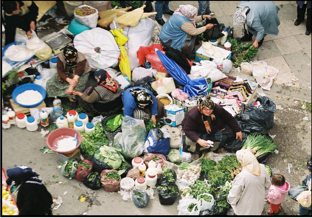
Foto 9: Ağabali Caddesi üzerinde kurulan pazarda elişi, sebze ve sütü bir arada satan köylü kadınlar.