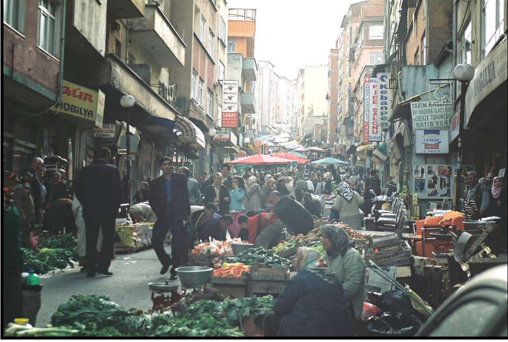
Foto 10: Unkapanı Caddesi üzerinde kurulan Hastanebaşı Pazarı'nın tüm caddeyi sabahın erken saatlerinden gecenin geç vaktine kadar kapatan görüntüsü.

- Pazar yerinde erken saatlerde başlayan gürültü patırtı, çadır kurma telaşı, bu aradaki bağırış-çağırışlar çevredeki halkın huzurunu bozarak büyük sıkıntılar yaratmakta, evinde hastası ve küçük çocuğu olanlar için bu günler büyük eziyete dönüşmektedir. Özellikle yazın bu gürültü 05.00'den başlayıp gece 22.00'ye kadar devam etmektedir.