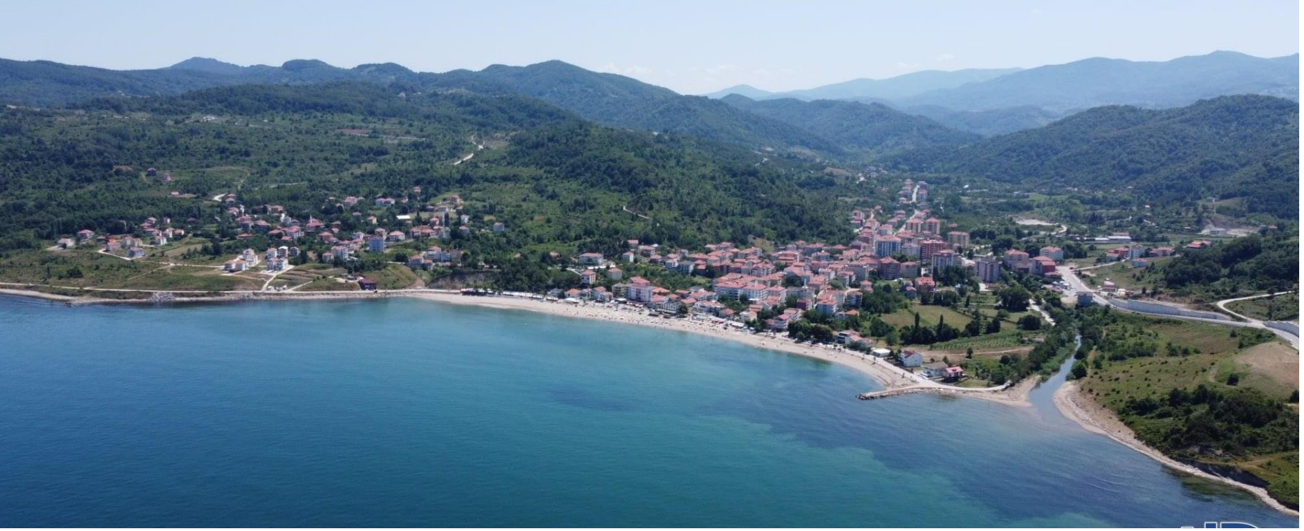
TÜRKELİ – GÜZELKENT KÖYÜ VE SAHİLİ