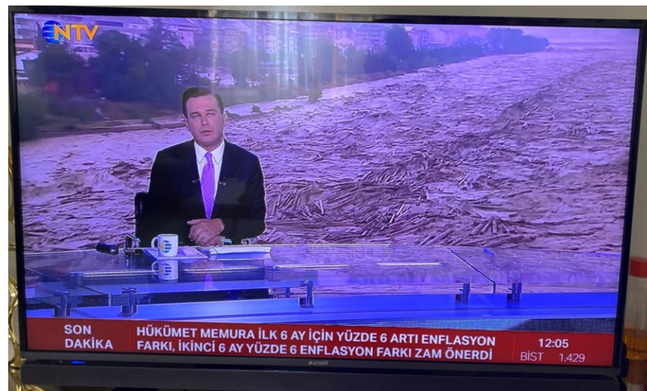
AYANCIK İLÇE MERKEZİ