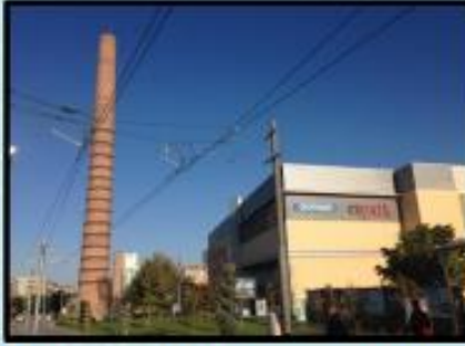
Foto 10. Eskişehir'de eski Kurt Tuğla - Kiremit Fabrikası'ndan kalan baca. Fabrika yıkılıp yerini Espark AVM'ye bırakınca fabrikadan kalan bu baca tek tek numaralandırılarak sökülmüş ve yeniden aslına uygun olarak inşa edilmiştir. Tek başına bu baca bile şehir içinde bu semtte yaşayanlar ya da burayı ziyaret edenler açısından geçmişle bağ kurmada önemli bir fonksiyon icra etmektedir.

Foto 8-9. SEKA Kâğıt Müzesi, Türkiye'de kâğıt üretimi dendiğinde akla gelen en önemli kurum olan SEKA'da ziyaretçilere, her yönüyle kâğıdı, kâğıdın tarihini ve üretim süreçlerini keşfedecek bir düzenleme yapılmış ve farklı yaş gruplarına uygun çağdaş bir sergileme yaklaşımı kullanılmıştır.