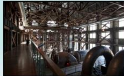
Foto 6-7. Santralistanbul'a dönüştürülen Silahtarğa Elektrik Santrali, Osmanlı Devleti'nin kent ölçekli ilk elektrik üretim tesisidir. Santralistanbul, bünyesinde gerçekleştirdiği sanatsal ve kültürel etkinlikler çerçevesinde kentsel canlanmaya katkıda bulunmayı hedefleyen kapsamlı, çok boyutlu ve