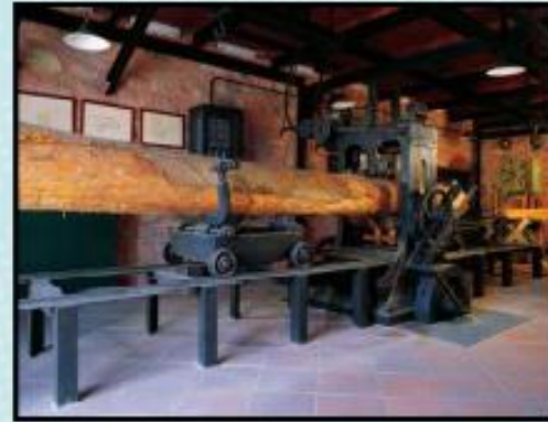
Foto 4-5. 1994 yılında ziyarete açılan Rahmi M. Koç Müzesi, Haliç'in kuzey yakasında yaklaşık 27 bin metrekarelik alana yayılan müze, üç ana bölümden oluşmaktadır. Müze için 1991 yılında geçmişi, Sultan III.Ahmet devrine uzanan tarihi Lengerhane binasının satın alınmasıyla başlamıştır. Bu binada yürütülen restorasyon çalışmalarının ardından Aralık 1994'de müze ziyarete açılmıştır. Kısa süre sonra sergileme alanlarının yeterli gelmesiyle Lengerhane'nin hemen karşısındaki, harap durumda olan Hasköy Tersanesi satın alınmış ve bu kısmın restorasyonu 2001 yılında tamamlanmıştır.