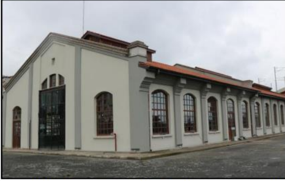
Foto 16. Müze olarak kullanılacak lokomotif tamir atölyesinin restorasyon sonrası görünümü.