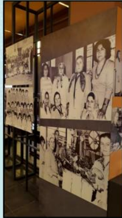
Foto 13-14-15. Müze içinde tütün üretiminin ve sigaraya dönüşümünün tüm aşamalarını anlatan fotoğraflar, bal mumu heykeller ve üretimde kullanılan alet ve makineler sergilenmektedir.