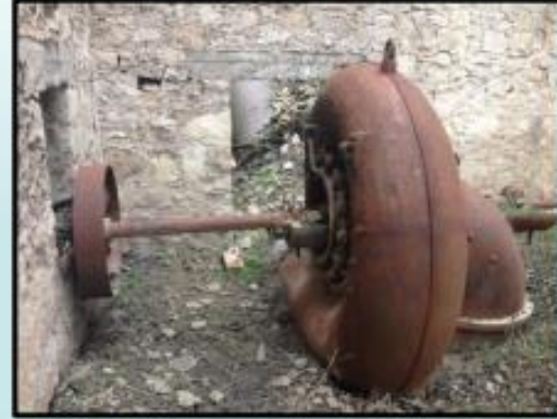
Foto 24-25. Hidrolik enerji ile üretim yapan tesis kendi döneminde yakın çevrenin en önemli endüstri yapılarından biri olarak yakın yıllara kadar üretime devam etmiştir.