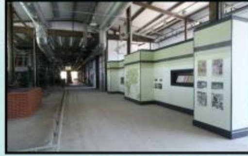
Foto 8-9. SEKA Kâğıt Müzesi, Türkiye'de kâğıt üretimi dendiğinde akla gelen en önemli kurum olan SEKA'da ziyaretçilere, her yönüyle kâğıdı, kâğıdın tarihini ve üretim süreçlerini keşfedecek bir düzenleme yapılmış ve farklı yaş gruplarına uygun çağdaş bir sergileme yaklaşımı kullanılmıştır.